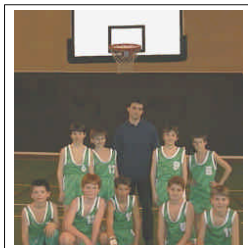
Les Poussins de Montigny le Bx Champions des Yvelines 1 ère Division.

1 ère DIVISION AS MONTIGNY Bx 44 / ES SARTROUVILLE 28