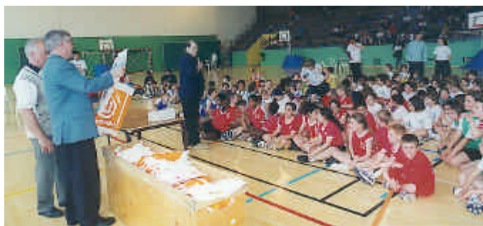
36 équipes – 12 clubs – 87 garçons et 50 filles !!

Malgré les fêtes de l'ascension, la fête nationale du basket a rassemblé près de 140 enfants. Pour cette fête, nous avons eu beaucoup de mal à motiver les clubs. Pourtant comme les autres rassemblements, nous avons réussi à leur donner satisfaction, ainsi qu'à tous les enfants présents.